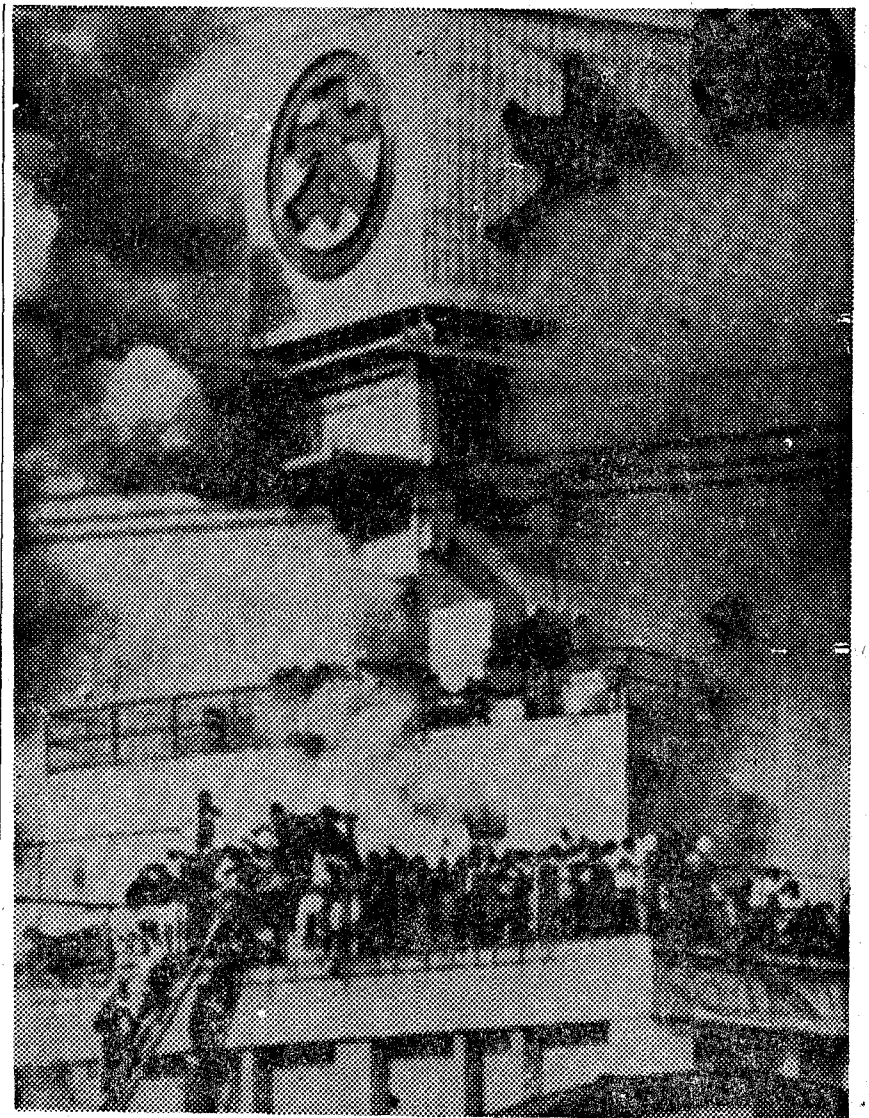
DE LA CATASTROFE EN UNOS ALMACENES JAPONESES. — Sigue llegando a nuestra Redacción más información gráfica del terrible incendio que ha destruido unos grandes almacenes en la ciudad japonesa de Kumamoto y que, de momento, ha causado 107 muertos y más de un centenar de heridos. En la telefoto de AP se aprecia a la muchedumbre que buscó la salvación en la azotea, y de donde fue liberada por helicópteros de la policía y las largas escaleras de los bomberos

también en frenos de disco confíe en... Plastex Lic. The Bendix Corp. LAS PLACAS DE FRENO DE DISCO Plastex SON EL RESULTADO DE UNA LARGA EXPERIENCIA EN MATERIAL DE FRICCIÓN. Plastex VIZCAYA, 356 Tel. 3490785 BARCELONA(13)